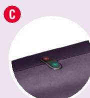
Светодиодная и звуковая индикация подтверждения статуса затяжки для OK / NG