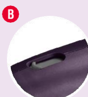
Регулируемая муфта автоматического отключения